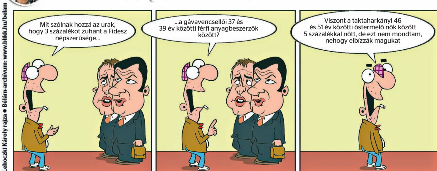
Lehoztki Károly rajza